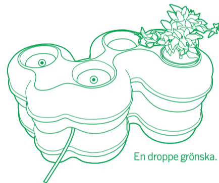
En droppe grönska.

Streamgarden är din personliga trädgård till hemmet eller ditt kontor. Designen bygger på en teknik som kallas hydrokultur eller hydroponics. Hydroponics innebär odling utan jord i rent vatten med näring i optimal mängd. Tekniken används av NASA på rymdstationer och i andra extrema miljöer. I dag är denna teknik också vanlig i kommersiella växthus världen över för att exempelvis odla grönsaker som tomater och gurka.