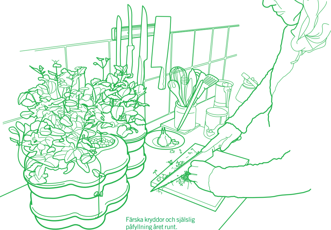
Färsk kryddor och själslig påfyllning året runt.

Jag avslutar mitt besök på Green Fortune Hötorget i ljuscaféet som är en tropisk lustgård mitt i city. Jag väljer den permatropiska salladen, en gotländsk chardonnay och en Sthlm Lime Paj. Självfallet med helt färsk grönsaker och frukter, medan snön dansar utanför det skyddande glashöljet.